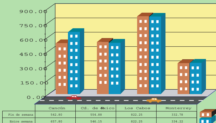
Tarifa diaria promedio de un auto compacto durante fin de semana y entre semana

Otro factor que influye en la tarifa es si el auto se renta en fin de semana o entre semana. En el caso de un auto compacto rentado durante el periodo vacacional de diciembre, la tarifa promedio subió 21.2% entre semana en Cancún, respecto al nivel de fin de semana. En la Ciudad de México, en cambio, la tarifa promedio disminuyó ligeramente entre semana (1.6%).