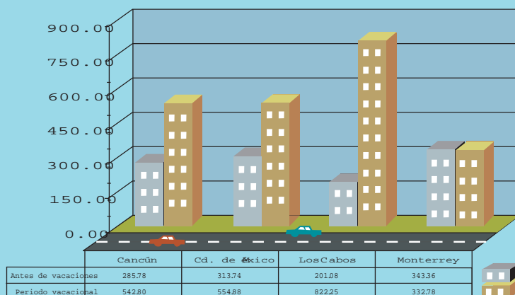
Tarifa diaria promedio de un auto compacto antes de vacaciones y en periodo vacacional

La influencia de la temporada alta en las tarifas de renta de autos se observa más claramente en la gráfica siguiente, que compara la tarifa diaria promedio por ciudad de un auto compacto antes del periodo vacacional de diciembre pasado, con la observada en pleno periodo vacacional. En general, la tarifa se incrementó de manera importante en vacaciones (con excepción de Monterrey, donde disminuyó ligeramente), destacando Los Cabos, con un incremento de 308.9%.